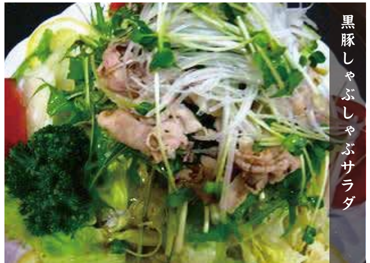
黒豚しゃぶしゃぶサラダ