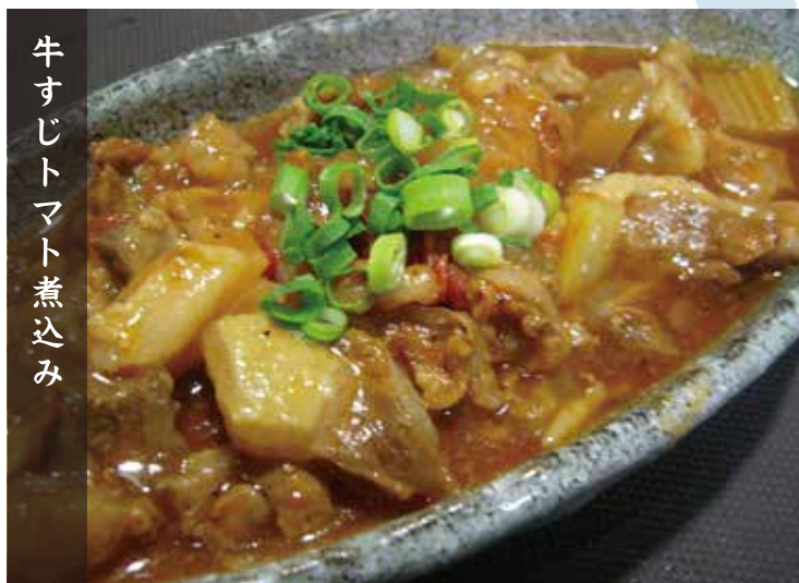
牛すじトマト煮込み