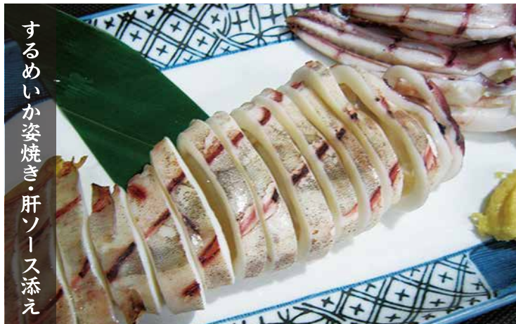
するめいか姿焼き・肝ソース添え