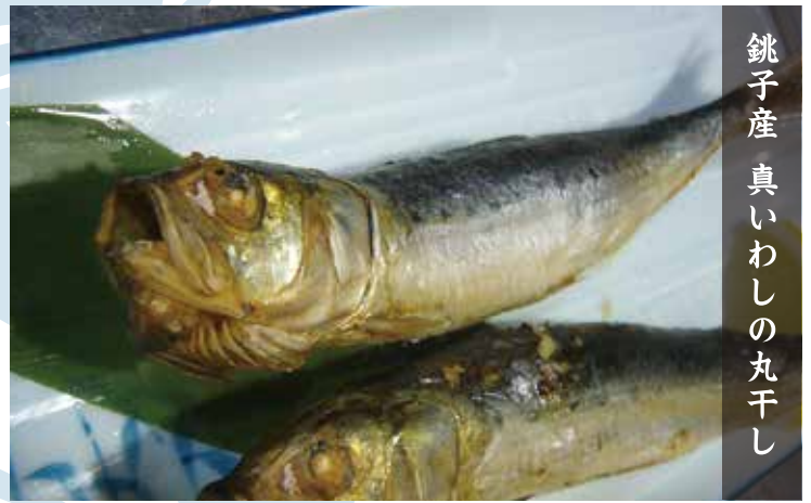
銚子産 真いわしの丸干し