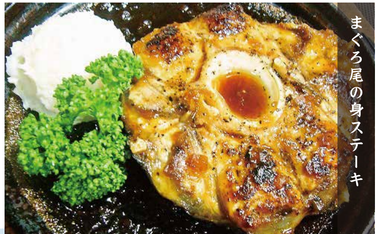
まぐろ尾の身ステーキ