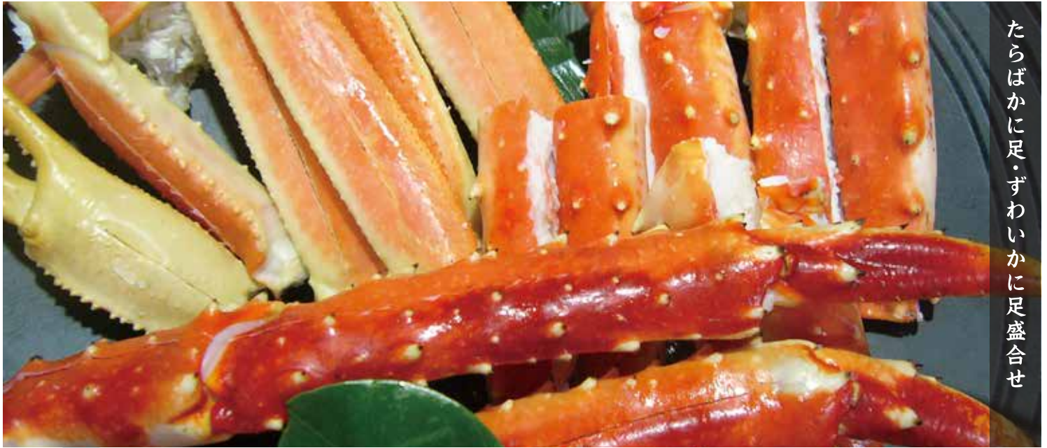
たらばかに足・ずわいかに足盛合せ